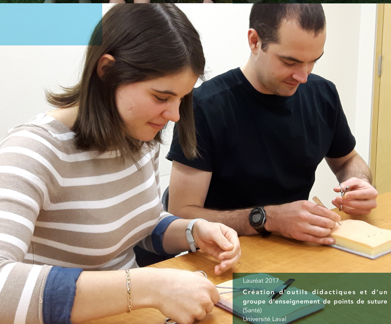
Lauréat 2017 Création d'outils didactiques et d'un groupe d'enseignement de points de suture (Santé) Université Laval

Ces catégories visent à reconnaître, à promouvoir et à honorer des étudiants ou des groupes d'étudiants s'étant distingués par la réalisation de projets liés à l'un ou l'autre des domaines qui suivent :