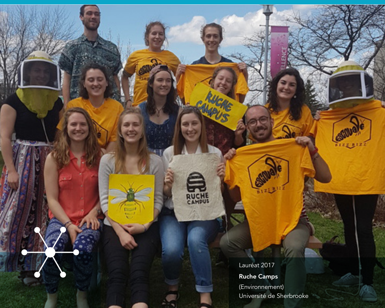
Lauréat 2017 Ruche Camps (Environnement) Université de Sherbrooke