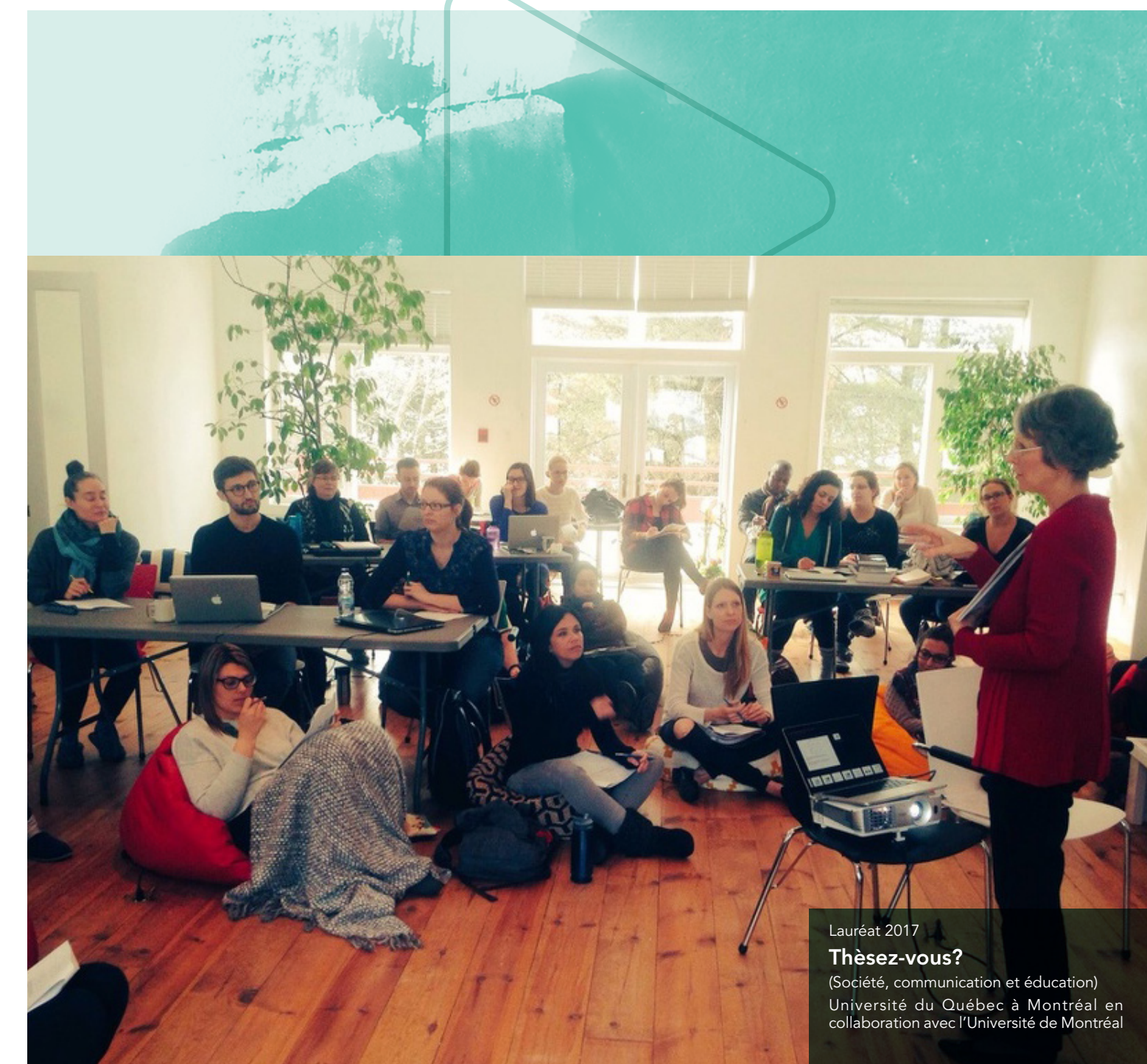
Lauréat 2017 Thésèz-vous? (Société, communication et éducation) Université du Québec à Montréal en collaboration avec l'Université de Montréal