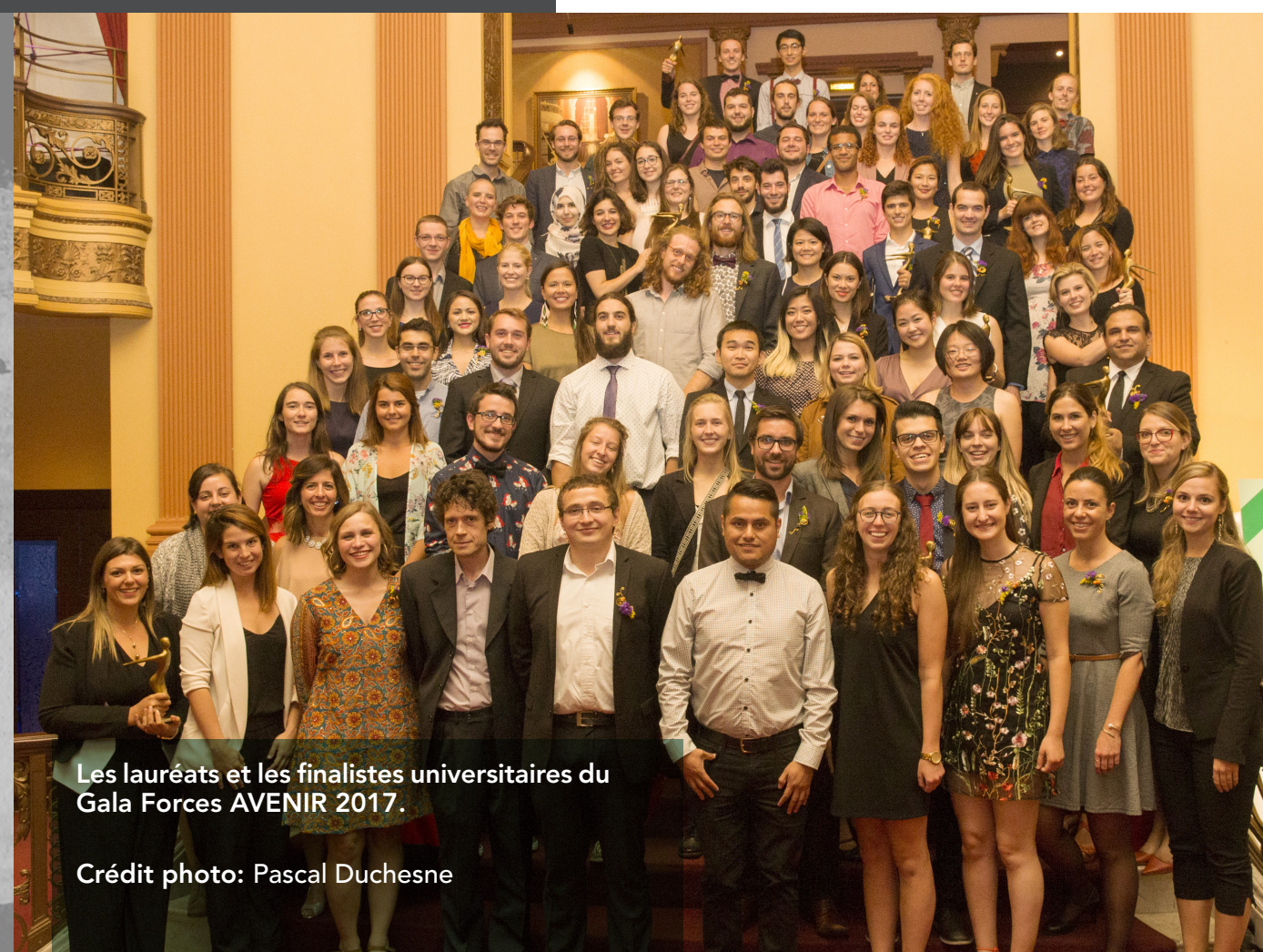
Les lauréats et les finalistes universitaires du Gala Forces AVENIR 2017.